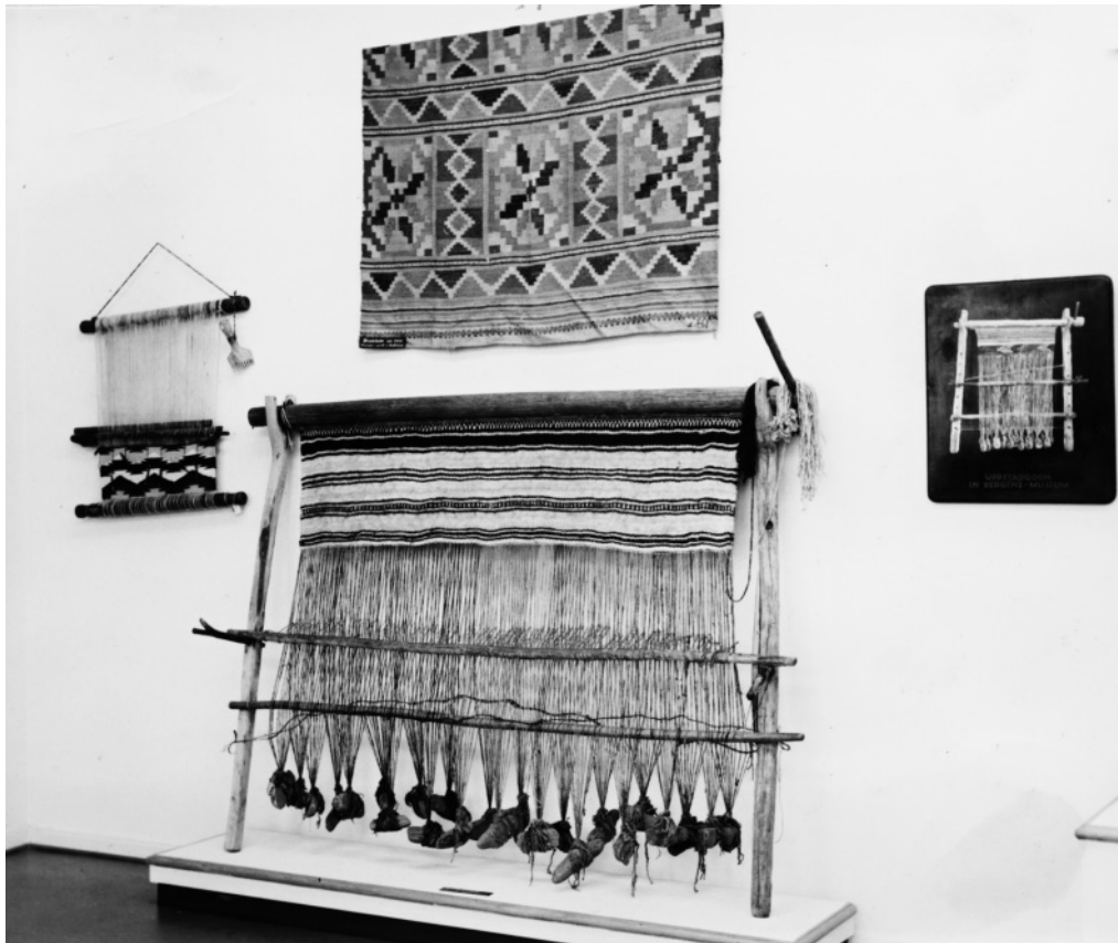
Abb. 3: Gewichtswebstuhl aus Norwegen in der Ausstellung des Textilmuseums 1952.

Reihen 70 Webgewichte gelegen haben. Nach seinen Beobachtungen muss der Webstuhl 270 cm breit gewesen sein. Rechts neben dem Eingang befanden sich weitere 12 Webgewichte. Auf der Nachzeichnung des Grabungsplanes sind allerdings nur 62 Webgewichte eingezeichnet, von denen 21 in zwei Reihen geordnet sind. Sie liegen im nördlichen Teil parallel zur Nordwand, die übrigen verstreut auf dem Fußboden. Ein in diesem Haus gefundenes gegabeltes Holzstück, das früher als „Webschiffchen“ angesprochen wurde, dürfte nicht zum Weben am Gewichtswebstuhl verwendet worden sein, da zum Eintrag des Schussfadens am Gewichtswebstuhl keine Webschiffchen benötigt werden.