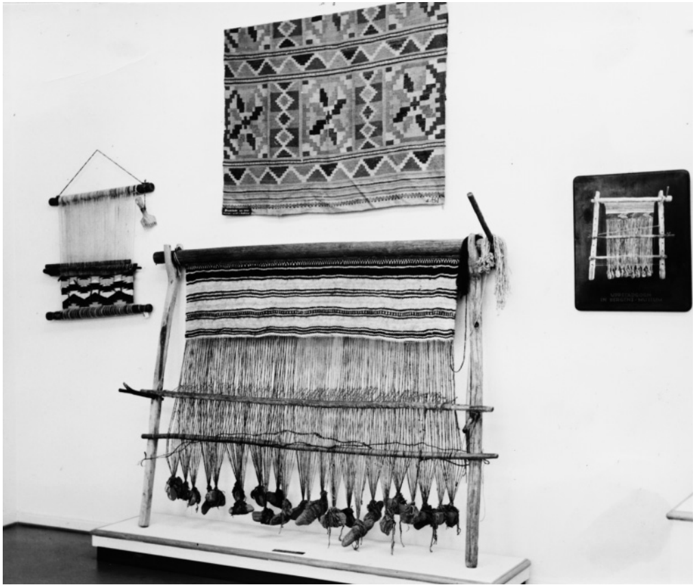
Abb. 3: Gewichtswebstuhl aus Norwegen in der Ausstellung des Textilmuseums 1952.

Reihen 70 Webgewichte gelegen haben. Nach seinen Beobachtungen muss der Webstuhl 270 cm breit gewesen sein. Rechts neben dem Eingang befanden sich weitere 12 Webgewichte. Auf der Nachzeichnung des Grabungsplanes sind allerdings nur 62 Webgewichte eingezeichnet, von denen 21 in zwei Reihen geordnet sind. Sie liegen im nördlichen Teil parallel zur Nordwand, die übrigen verstreut auf dem Fußboden. Ein in diesem Haus gefundenes gegabeltes Holzstück, das früher als „Webschiffchen“ angesprochen wurde, dürfte nicht zum Weben am Gewichtswebstuhl verwendet worden sein, da zum Eintrag des Schussfadens am Gewichtswebstuhl keine Webschiffchen benötigt werden.