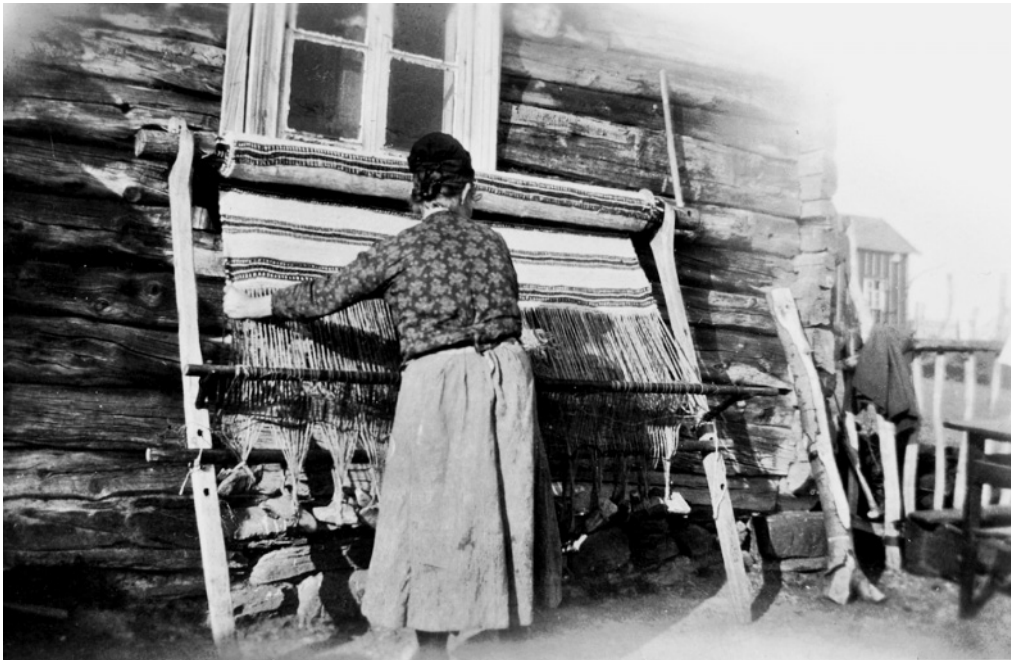
Abb. 2: Weben an einem Gewichtswebstuhl in Amble Sogn/Norwegen um 1930.

Gelände im Bereich des „Groten Kamp“ von der Stadt Neumünster als Baugelände ausgewiesen war, wurde 1953 eine Probegrabung durchgeführt. Sie zeigte die Notwendigkeit, vor der Bebauung umfassende Ausgrabungen durchzuführen. 1954 wurde mit einer größeren Flächengrabung begonnen. Sie ergab, dass sich in der Nähe der Stör eine größere Siedlung befand. In weiteren Ausgrabungen in den nächsten Jahren konnten auf einer Grabungsfläche von rund 7500 m 2 die Grundrisse von 65 Häusern nachgewiesen werden. Es handelt sich um Flach- und Grubenhäuser unterschiedlicher Größe, die als Wohnhäuser, Speicher und Werkstätten benutzt wurden. Die ältesten Häuser dürften im ausgehenden 8. Jh. gebaut worden sein, die jüngsten in der ersten Hälfte des 10. Jh.s. Die Siedlung wurde um 940 aufgegeben. Die wichtigsten Befunde und Funde hat Hans Hingst in mehreren Aufsätzen in archäologischen Fachzeitschriften vorgestellt (Hingst z.B. 1955 in Germania 33, 264–265). Zu den Funden gehören auch Spinnwirtel und Webgewichte, die auf eine umfangreiche Textilproduktion schließen lassen. Eine Veröffentlichung aller Untersuchungsergebnisse steht allerdings noch aus.